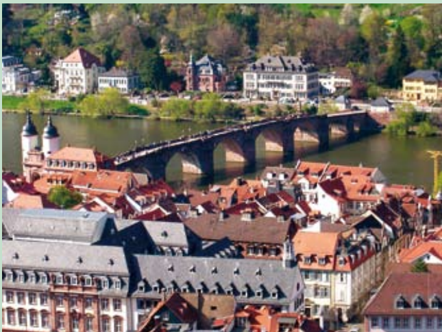
Heidelberg (Altstadt & Schloss)