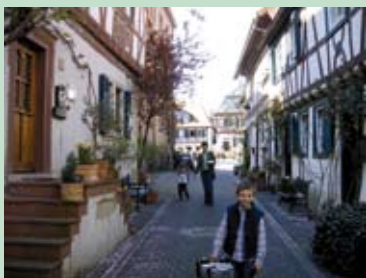
Altstadt von Heppenheim